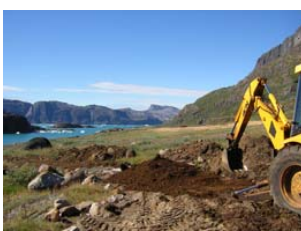
construction d'un chemin