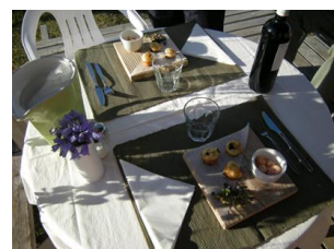
dîner après la pêche