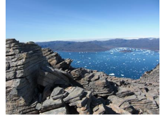
vue sur le fjord voisin

Située le long du fjord principal reliant Narsarsuaq - l'aéroport international du Sud du pays - aux villes de Narsaq puis Qaqortoq, Ipiutaq guest farm offre une grande diversité de paysages , des hauts pics enneigés, torrents et chutes d'eau aux longues plages rocheuses et verts pâturages.