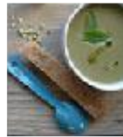
soupe à l'oseille