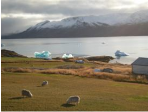
moutons et glaces

Une aventure de pêche exceptionnelle et une gastronomie originale