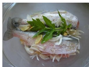
Ombre chevalier au four