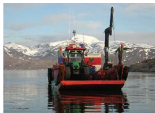
livraison d'un tracteur