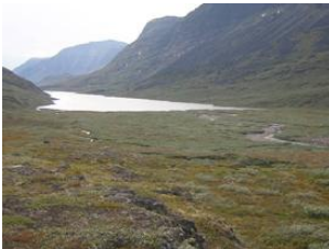
depuis la rivière vers le lac

La rivière se déverse dans un lac de 2,5 km de long relié au fjord par une portion de rivière d'environ 200 m où beaucoup de poissons remontent vers le lac à marée haute. Cette section de la rivière se déverse dans l'"ilua" – qui signifie "à l'intérieur" en Groenlandais – la partie protégée du fjord, puis dans le fjord « libre ».