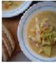
soupe de poissons