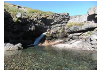
pool aux eaux claires...