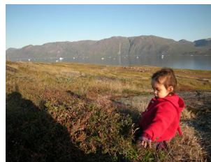
la cueillette de baies