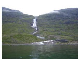
chute d'eau au bout du lac