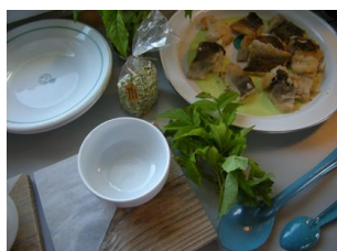
poisson en cuisine