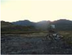
sur le chemin de la rivière

La rivière principale s'étend sur environ 3 km et offre une grande variété de sections, comme des rapides, des pools profonds et clairs ou encore des chutes d'eau et des parties rocheuses. Depuis Ipiutaq guest farm, il faut compter environ 45 minutes de marche pour atteindre la partie principale de la rivière.