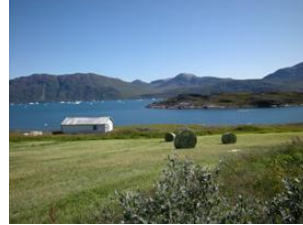
l'été à Ipiutaq