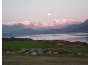
au bout du monde