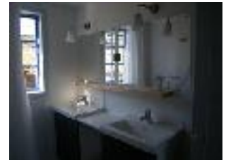
salle de bains

Notre maison d'hôtes située près du fjord, est rénovée et ouverte depuis le 1 er Juillet 2013. La maison peut accueillir au maximum 6 à 8 personnes. Elle est entièrement équipée : une chambre avec un lit double, une chambre avec 4 lits, un séjour avec canapé-lit, une cuisine avec une grande table pour les repas, une salle de bains avec 2 douches et des toilettes (litière complète et serviettes de toilette incluses).