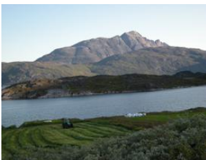
la saison des foins Ipiutaq

A Ipiutaq guest farm, vous pouvez découvrir l'agriculture et la nature sauvage du Groenland , partager notre table d'hôtes en découvrant une nouvelle cuisine , profiter des activités de plein air , telles que la randonnée, la cueillette de baies ou le travail à la ferme, ou bien vous détendre en admirant le paysage dans un cadre inhabituel et somptueux .