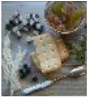
peau de baleine