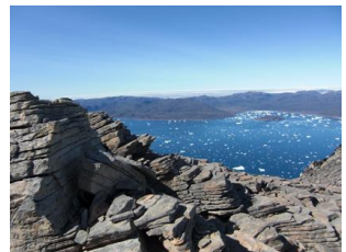
vue sur le fjord voisin

A Ipiutaq guest farm, vous pouvez découvrir l'agriculture et la nature sauvage du Groenland , partager notre table d'hôtes en découvrant une nouvelle cuisine , profiter des activités de plein air , telles que la pêche, la randonnée ou le travail à la ferme, ou bien vous détendre en admirant le paysage dans un cadre inhabituel et somptueux .