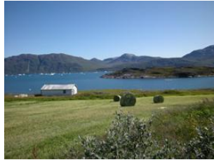
l'été à Ipiutaq