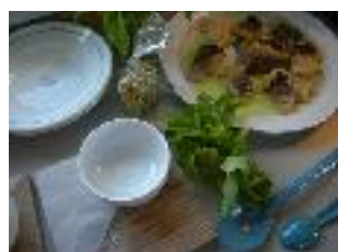
cuisiner le poisson...