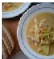
soupe de poissons