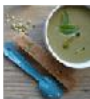
soupe à l'oseille