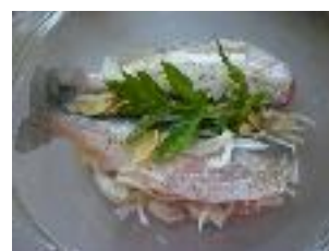
ombles de l'Arctique

“A Ipiutaq, le mélange particulier d'une excellente gastronomie, du confort et de la nature sauvage Groenlandaise, est absolument unique, hautement « addictif » et réellement inoubliable...”