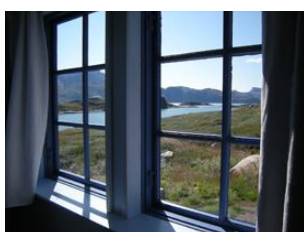
vue depuis une chambre...

Notre chambre d'hôtes est très confortable, avec un lit double (literie complète et serviettes de toilette incluses), une décoration originale et chaleureuse, ainsi que de très belles vues sur le fjord et les pics enneigés.