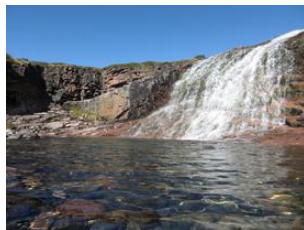
au pied d'une chute d'eau