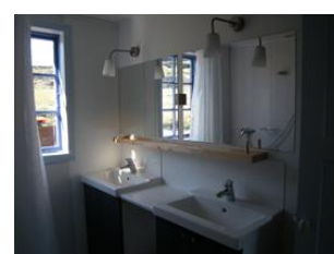
salle de bains

Notre chambre d'hôtes est très confortable, avec un lit double (literie complète et serviettes de toilette incluses), une décoration originale et chaleureuse, ainsi que de très belles vues sur le fjord et les pics enneigés.