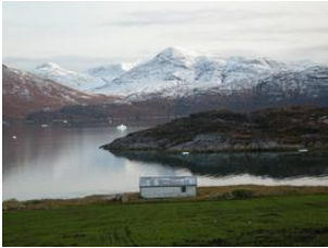
le printemps à Ipiutaq

Située le long du fjord principal du sud du Groenland