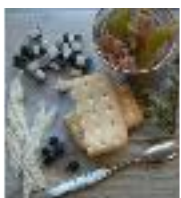
peau de baleine

Une cuisine raffinée et originale : des produits locaux revisités par la tradition française