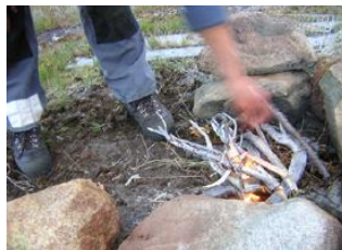
chaleur en plein air