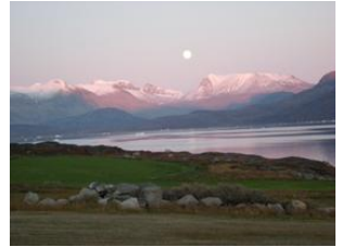
au bout du monde

Située le long du fjord principal reliant Narsarsuaq - l'aéroport international du Sud du pays - aux villes de Narsaq puis Qaqortoq, Ipiutaq guest farm offre une grande diversité de paysages , des hauts pics enneigés, torrents et chutes d'eau aux longues plages rocheuses et verts pâturages.