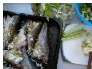
morues de l'Atlantique