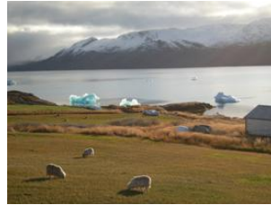
glaces et moutons